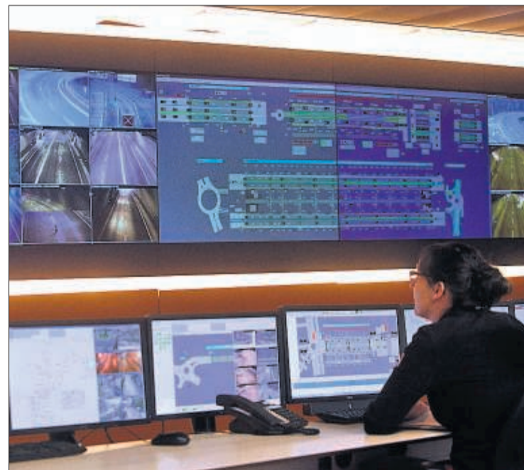
Sala de control del Centre Nacional del Trànsit.

Les retencions van ser destacades divendres i dissabte, a la carretera N-145 per accedir al Principat i a la CG-2, al Pas de la Casa, per creuar la frontera en direcció a França.